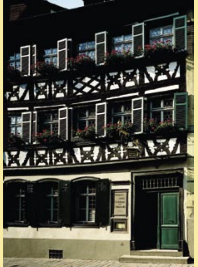
oben und links: Gasthaus Schlenkerla in Bamberg, Ausschank direkt vom Holzfass

Doch durch wirtschaftliche und gesellschaftliche Veränderungen wurden und werden zahlreiche dieser historischen, häufig in Familienbesitz befindlichen Wirtshäuser aufgegeben, manche gar abgerissen. Damit gehen eine