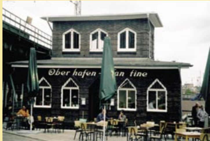
Oberhafenkantine in Hamburg-Klostertor, 1925 als Kaffeeklappe erbaut, Foto: H. Barth