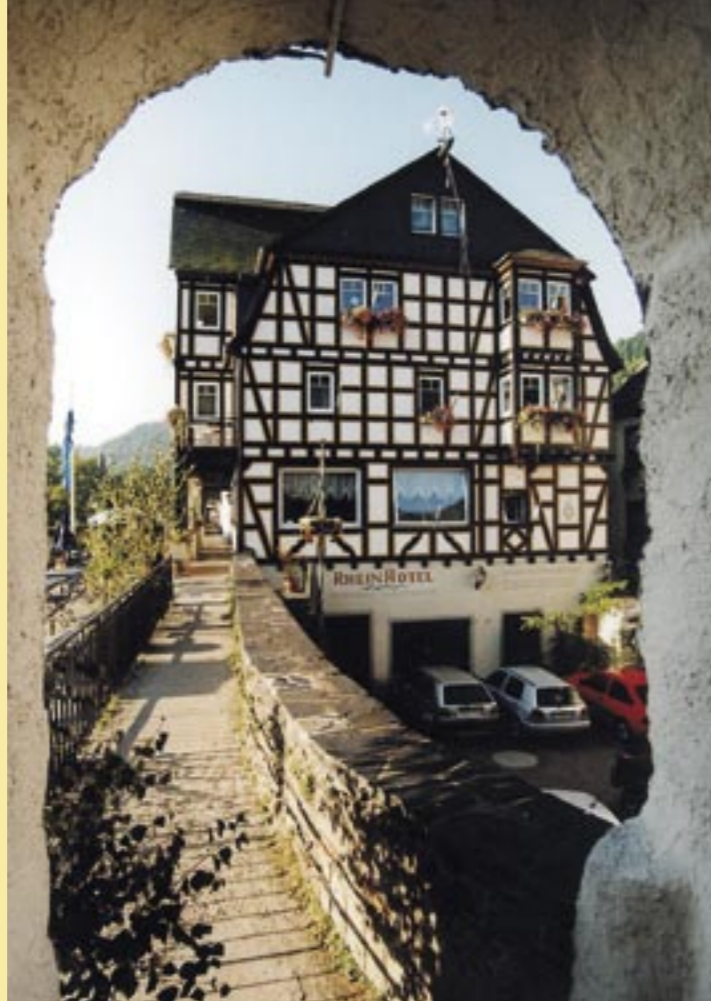
Rheinhotel in Bacharach, Rheinland-Pfalz, Foto: A. Stüber

Der Bund Heimat und Umwelt ist der Bundesverband der Bürger- und Heimatvereine in Deutschland und vertritt über seine Landesverbände die Interessen von rund einer halben Million Menschen vor Ort. Seit seiner Gründung im Jahr 1904 widmet sich der BHU dem Erhalt und der Entwicklung unserer Kulturlandschaften.