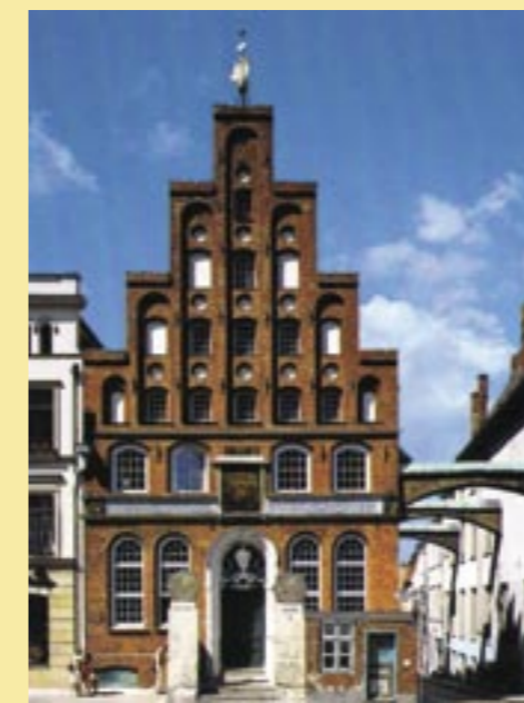
Haus der Schiffergesellschaft zu Lübeck, Schankraum im Haus der Schiffergesellschaft zu Lübeck

Wir würden uns freuen, wenn Sie mit Ihrem Beitrag zum Gelingen unseres Vorhabens beitragen! Bitte senden Sie dazu den ausgefüllten Teilnehmerbogen, ergänzt durch Bildmaterial, an uns zurück.