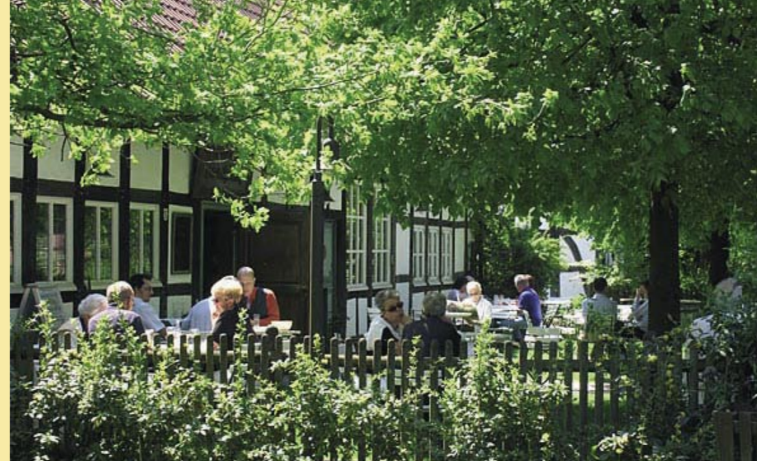
Biergarten in Süddeutschland

Im Jahr 2008 hat der BHU die Wirtshäuser zum Kulturdenkmal des Jahres gekürt und erhielt bereits damit eine hohe Resonanz in der Öffentlichkeit. Daher bietet der BHU in Kooperation mit dem DEHOGA nun die Möglichkeit, Wirtshäuser vorzustellen. Wir suchen historische Wirtshäuser, um die bundesweit vorhandene kulturelle und bauhistorische Vielfalt zu zeigen.