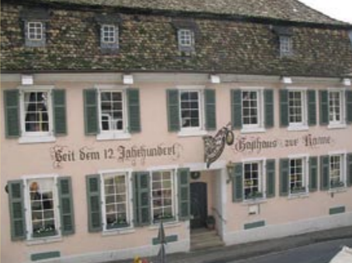
Gasthaus zur Kanne in Deidesheim, Ältestes Gasthaus der Pfalz

Die Speisekarte war in der Regel durch die regionale, gutbürgerliche Küche geprägt. Deftige, nahrhafte und traditionell zubereitete Gerichte waren gewünscht. Auch heute stehen frische regionale und saisonale Spezialitäten – teilweise modern interpretiert – wieder hoch im Kurs. Jetzt geht es darum, die wichtige Rolle der Wirtshäuser in den Fokus der Öffentlichkeit zu stellen.